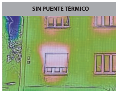
EPAM Elevada eficiencia energética