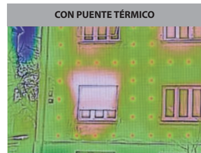
Anclaje tradicional Reducida eficiencia energética